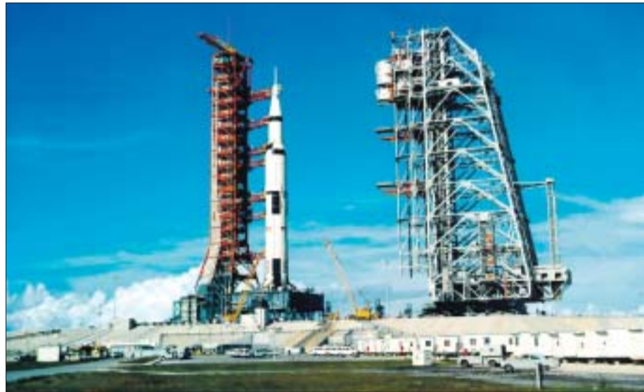
Lanzamiento de un cohete espacial desde la base de Cabo Cañaveral.

El día 20 de julio, Armstrong y Aldrin se separaron de Collins, que permaneció en la nave nodriza , y descendieron a la superficie de la Luna con el módulo Águila , que se