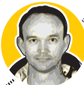
Piloto del Columbia