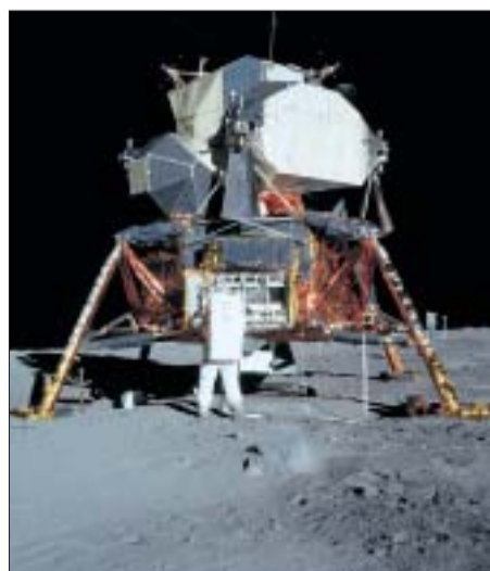
El módulo lunar.

posó con suavidad en la llanura polvorienta del Mar de la Tranquilidad. Eso sucedió a las 20.17 horas de tiempo universal del día 20, las 21.17 en España.