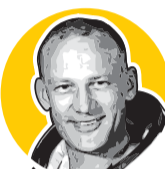
Comandante. Primer hombre en pisar la Luna

22 de julio de 1969 13. La tripulación aborda el módulo de Comando.