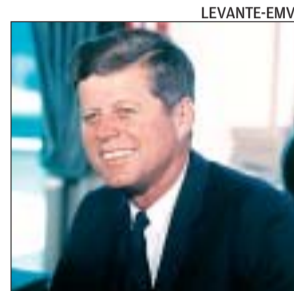
John Fitzgerald Kennedy.

▶ El vicepresidente de Estados Unidos, Lyndon B. Johnson, envía su famosa carta al presidente John Fitzgerald Kennedy, en la que le advierte: «A los ojos del mundo, el primero en llegar al espacio significa el primero; el segundo en llegar al espacio significa el segundo en todo».